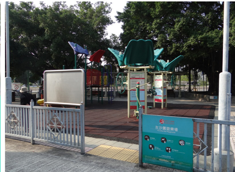
LR2.3 Fui Sha Wai Playground 灰沙圍遊樂場