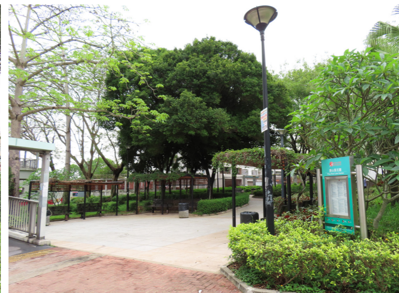
LR9.6 Ping Shan Lane Garden 屏山里花園