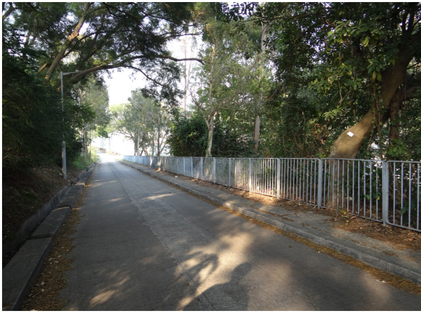
LR6 Roadside Vegetation