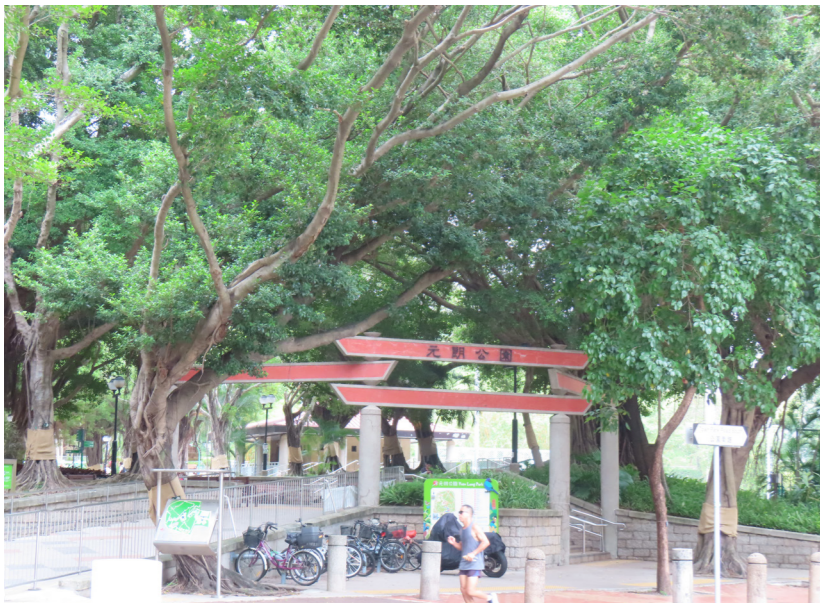
LR9.1 Yuen Long Park 元朗公園