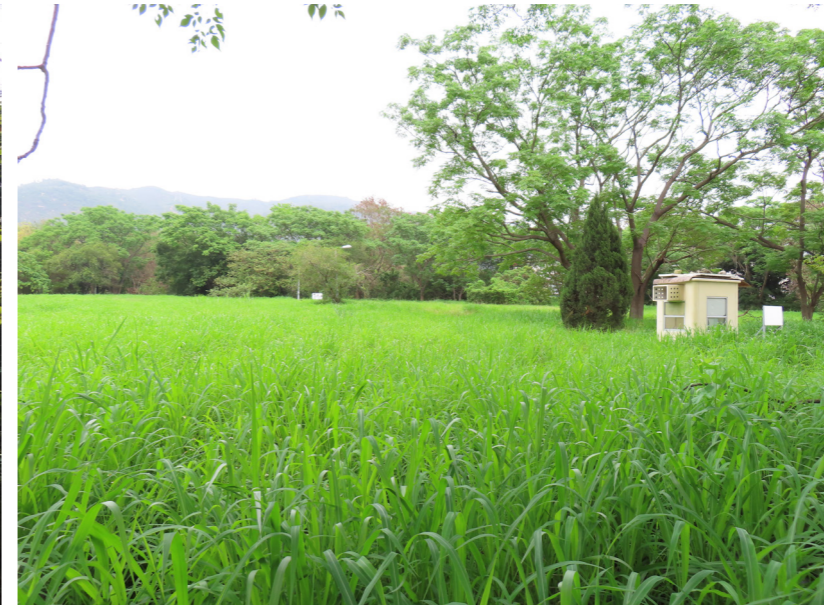
LR8 Shrubland/ Grassland