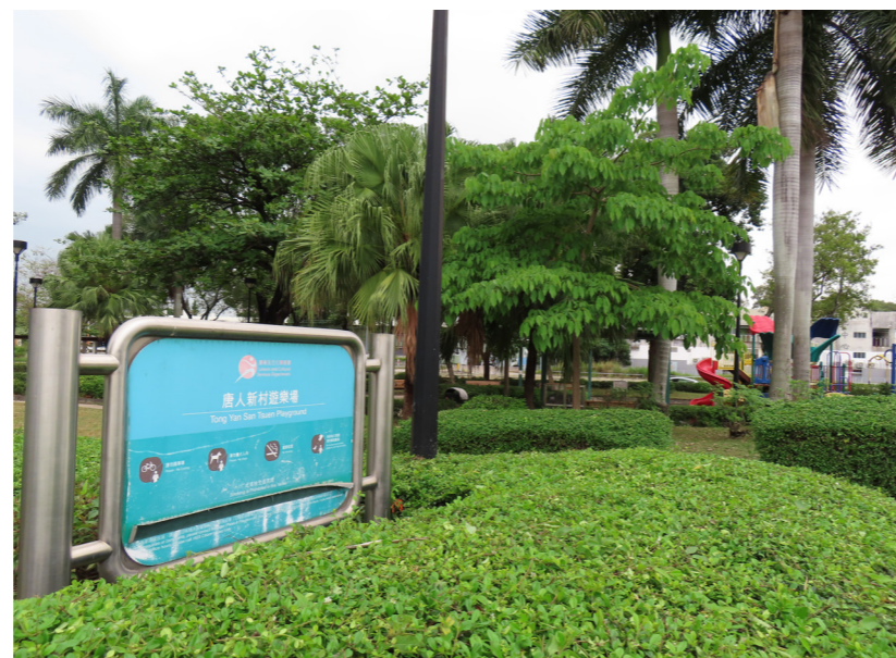
LR9.5 Tong Yan San Tsuen Playground 唐人新村遊樂場