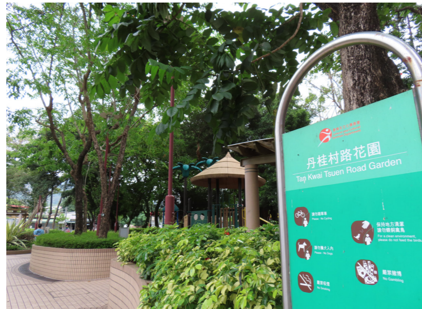
LR9.2 Tan Kwai Tsuen Road Garden 丹桂村路花園