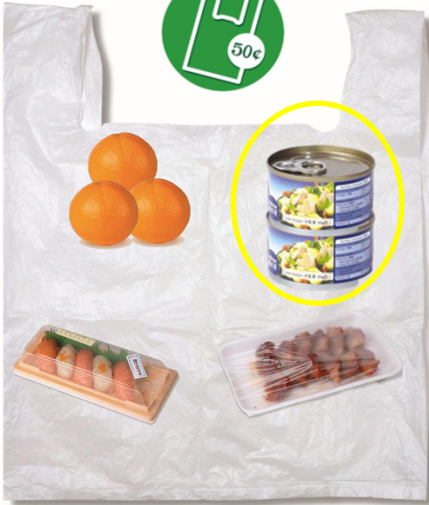
與氣密包裝的食品混合一起盛載