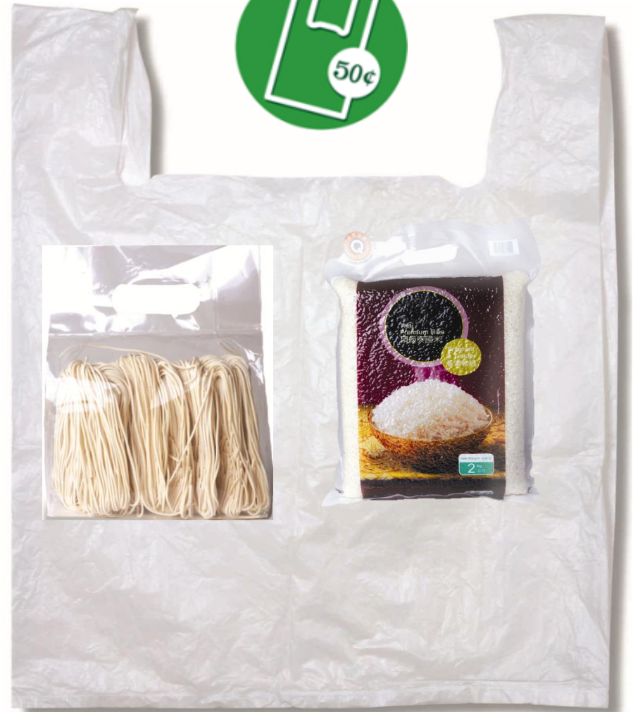
預先密封的包裝袋