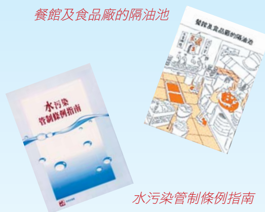
水污染管制條例指南